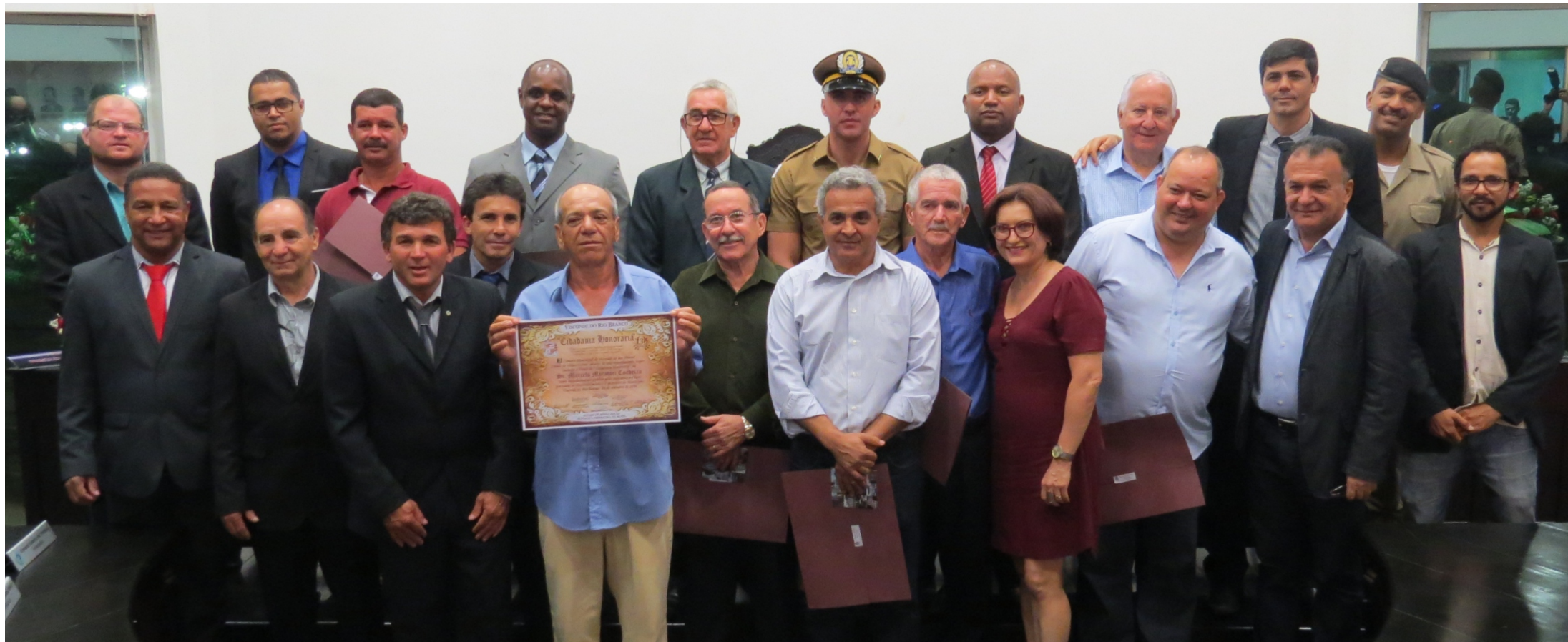
Os vereadores juntamente com os homenageados e o prefeito Municipal de Visconde do Rio Branco.

Na noite de 28 de setembro, finalizando as comemorações aos 136 anos de emancipação político-administrativa de Visconde do Rio Branco, a Câmara Municipal, em Sessão Solene, a entrega de títulos de "Cidadão Honorário de Visconde do Rio Branco".