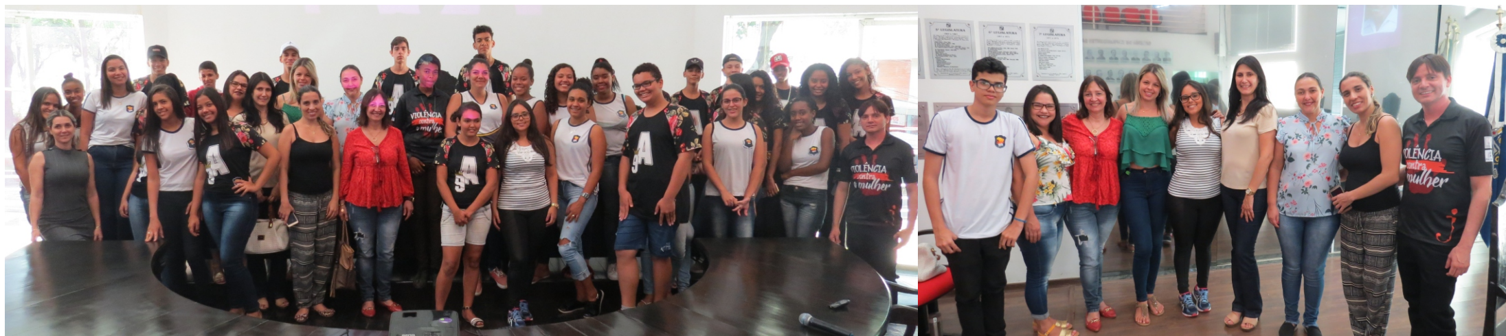
Parte do público presente ao evento na Câmara Municipal