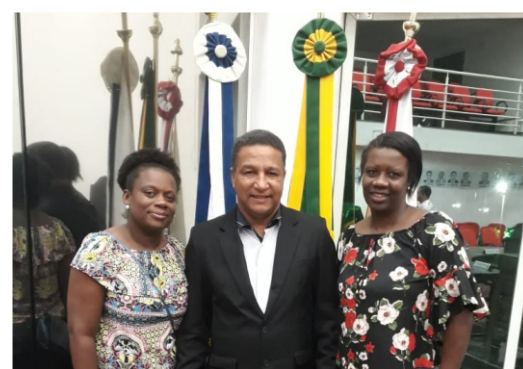
PREFEITURA MUNICIPAL DE VISCONDE DO RIO BRANCO ESTADO DE MINAS GERAIS

Praça 28 de Setembro, 317 - Bairro Centro - Visconde do Rio Branco/ MG - CEP: 36.520-000 *TEL.: (32) 3559-1900 * FAX: (32) 3559-1903 * Home Page: www.viscondedoriobranco.mg.gov.br