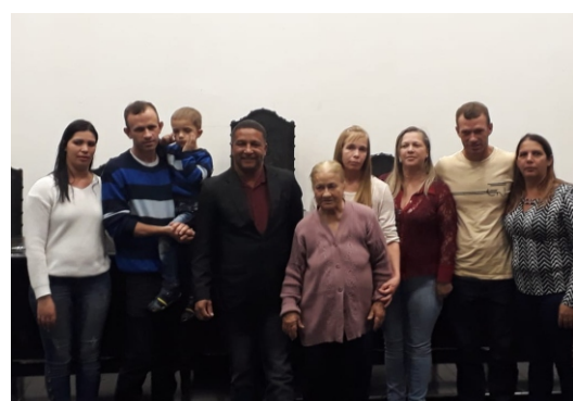
PREFEITURA MUNICIPAL DE VISCONDE DO RIO BRANCO ESTADO DE MINAS GERAIS