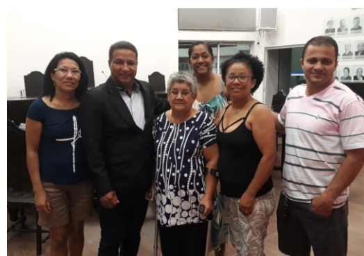
PREFEITURA MUNICIPAL DE VISCONDE DO RIO BRANCO ESTADO DE MINAS GERAIS

Praça 28 de Setembro, 317 - Bairro Centro - Visconde do Rio Branco/ MG - CEP: 36.520-000 *TEL.: (32) 3559-1900 * FAX: (32) 3559-1903 * Home Page: www.viscondedoriobranco.mg.gov.br