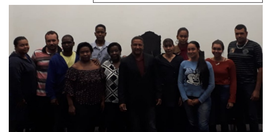
PREFEITURA MUNICIPAL DE VISCONDE DO RIO BRANCO ESTADO DE MINAS GERAIS