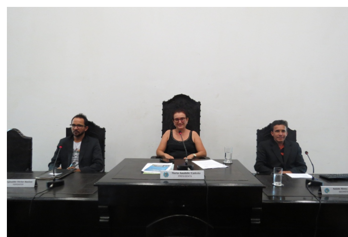
Nova mesa diretora para o Biênio 2019/2020