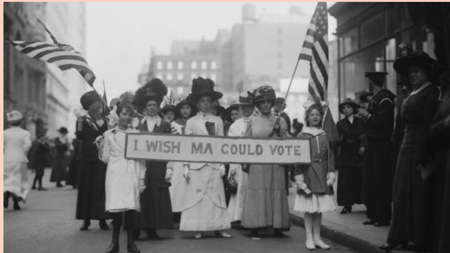
Mulheres americanas protestando à favor do direito ao voto

Mesmo a data sendo oficializada em 1975, os anseios das mulheres por igualdade ainda é atual. A desigualdade de gênero ainda acontece e pode ser percebida no mercado de trabalho, nas oportunidades e na política.