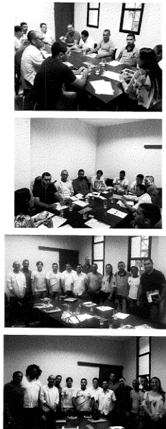
Coordenadores presentes na 2ª reunião do Polo Caparaó