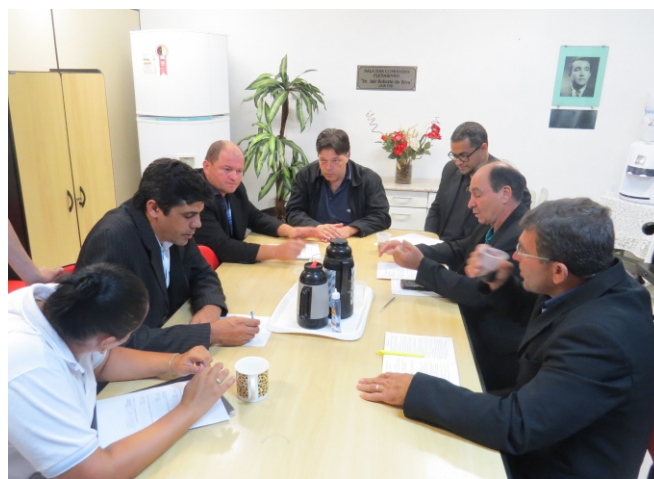
Vereadores reunidos para definirem os membros das Comissões