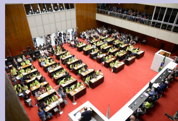
Alunos do Parlamento Jovem reunidos na Assembleia Legislativa

Discriminação étnico-racial é o tema eleito pelos estudantes para o Parlamento Jovem de Minas 2019, demonstrando o interesse destes jovens em discutir questões relacionadas à discriminação por raça, cor da pele e origem étnica.