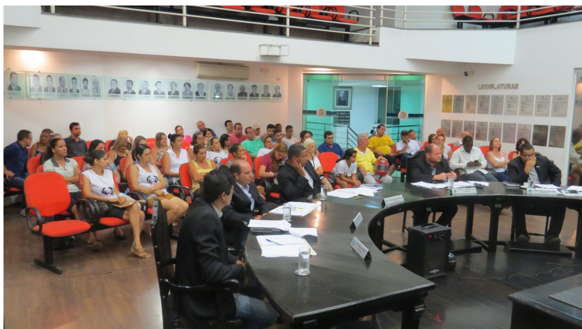
Vereadores da Câmara Municipal de Visconde do Rio Branco em sessão ordinária

Os vereadores fazem parte do Poder Legislativo, e discutem e votam matérias que envolvem impostos municipais, educação municipal, linhas de ônibus e saneamento, entre outros temas da cidade.