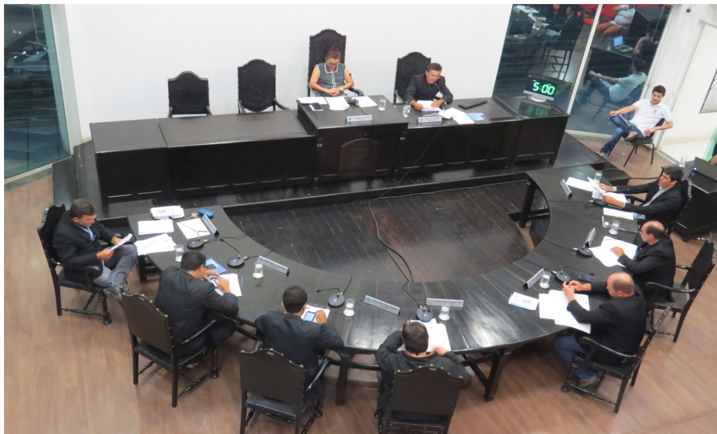
Vereadores reunidos na 1ª sessão da 1ª reunião ordinária

Na segunda-feira, dia 11/02, os membros das 5 Comissões Permanentes serão definidos e, após a escolha, os projetos começarão a ser analisados, e posteriormente, serão colocados em votação nas sessões ordinárias da Câmara Municipal.