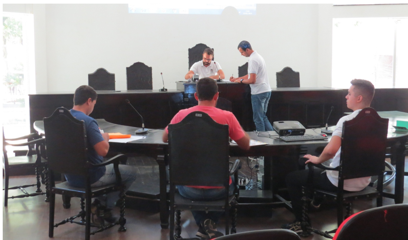
Equipe de pregão e licitantes

Por fim, conferiu-se às vistas dos autos às representantes das licitantes que permaneceram presentes até o final dos trabalhos. Não houve manifestação para interpor recursos. A sessão foi encerrada às 14 horas.